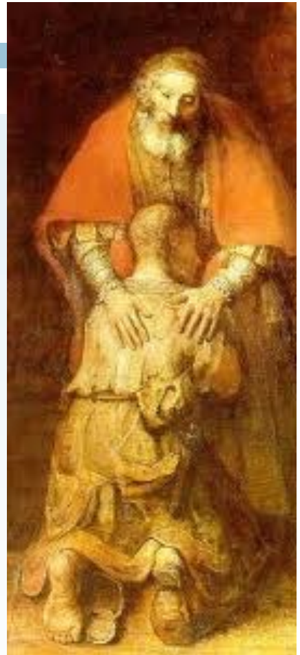
Rembrandt, Ritorno del figliol prodigo , 1668

In questa celebrazione penitenziale ci lasciamo guidare dalla parabola del Padre misericordioso, tenendo presente l'esperienza vissuta da Zaccheo: «Oggi per questa casa è venuta la salvezza, perché anch'egli è figlio di Abramo. Il Figlio dell'uomo infatti è venuto a cercare e a salvare ciò che era perduto» (Lc 10,9-10). Il desiderio di Zaccheo era quello di incontrare Gesù, di farlo entrare nella sua vita riconoscendo i suoi limiti, ma nello stesso tempo riconoscendo anche il bisogno forte di lasciarsi toccare dalla misericordia di Dio. Ogni giorno noi possiamo vivere l'esperienza di Zaccheo e del figliol prodigo se apriamo i nostri cuori e ci lasciamo toccare dall'amore di Dio, quell'amore che risana, ma soprattutto quell'amore che dà un senso a tutta la nostra esistenza. Con questi sentimenti vogliamo vivere questo momento di preghiera sperimentando la carezza di Dio che sempre ci aspetta per ridarci la dignità di figli suoi, perché anche noi possiamo sentirci "salvati per amore".